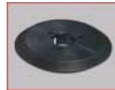
Diamantschleifscheibe für Profilschleifmaschine