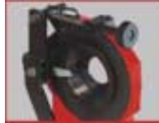
Ringlünette für Durchmesser von 15-75 mm bzw. 80-130 mm mit schnell auswechselbaren Scheiben