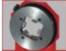
Vierbacken-Lünette stufenlos, verstellbar in 3 Ausführungen: 30-60 mm, 60-100 mm, 120-180 mm