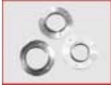
Spezialeinsatzscheiben für Ringlünette