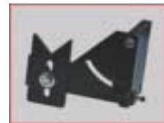
Einlegehilfe für Ringlünette