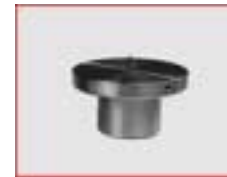
Scheibenfutter D 90 mm