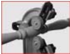
Lünette (nur für Handdrehkeln)