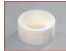
Topfschleifscheibe für WEMA BLITZ