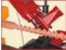
Fräsaggregat mit senkrecht eingestelltem Fräskopf