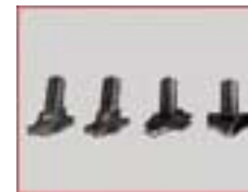
Satz Profilfräser, 4 Stck.