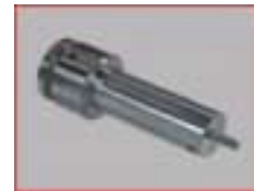
Scheibenfutter verlängert D 45 mm