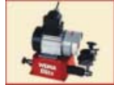
Schärfmaschine für Standard-Kopierdrehstähle (Spitzstähle), Typ BLITZ.