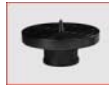
Planscheibe D 200 + 300 mm