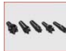
Sechszackmitnehmer kurz D 20, 30, 40