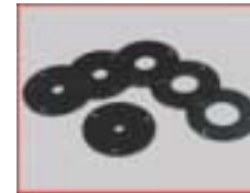
Einsatzscheiben für Ringlünette