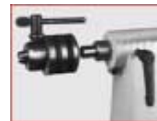
Zahnkranz-Bohrfutter mit Schlüssel und Kegeldorn, Spannweite 2-16 mm