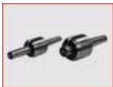
mitlaufende Körnerspitze MK2 m. Druckring