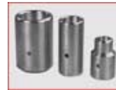
Einschlagfutter D 20, 30, 40, 50, 60