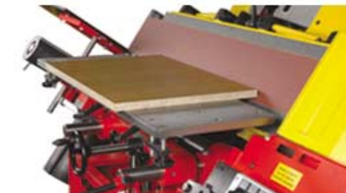
Schrägstellung des Schleifaggregates / Inclination of grinding aggregate