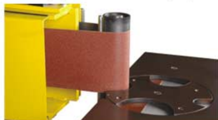
Schleifen von Rundungen / Curve grinder