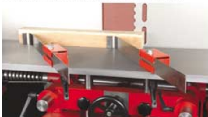
Federnde Leistenandrücker / Spring-mounted ledge press