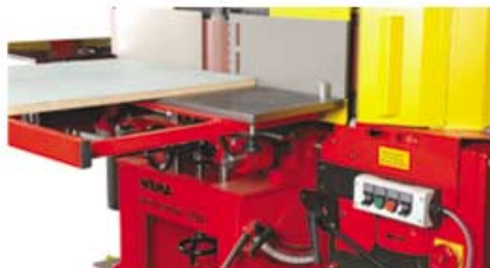
Tischverbreiterung für große Werkstücke / Table extension for large workpieces

The characteristic features of the profisander 2000 are its versatile use, economic efficiency and solid design. This all-round machine is not only ideal for sanding veneer edges but also for grinding curves, mitre joints, bevels and broken edges, for fitting drawers and for sanding the surfaces of small workpieces.